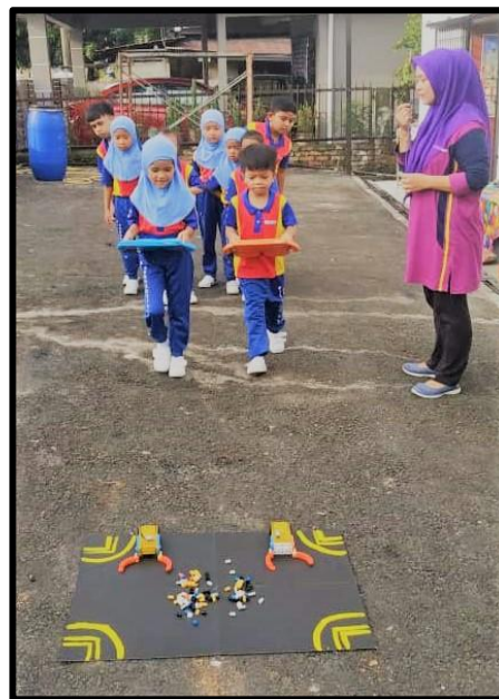
Guru menerangkan dan membuat demonstrasi permainan kepada kanak-kanak