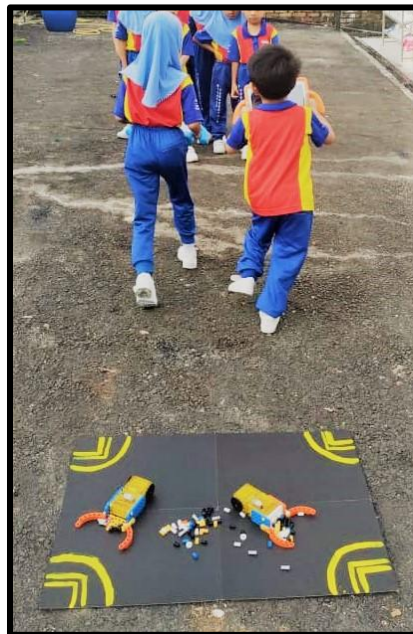
Kanak-kanak memulakan perlumbaan Zass Sedut