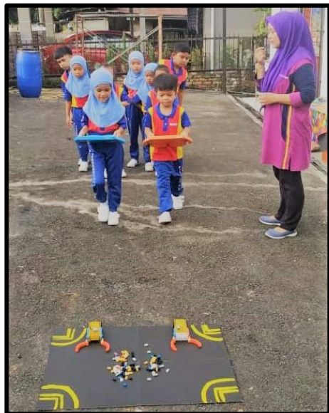
Kanak-kanak berasa gembira semasa aktiviti dijalankan